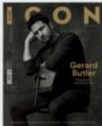
EN PORTADA Gerard Butler posa en exclusiva para ICON en Madrid, y vestido de Boss.

Suscripciones: 302 10146 suscripciones@prisarevistas.com 22 números - 24€