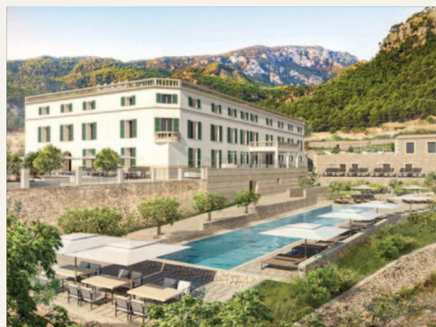
Son Bunyola Hotel and Villas