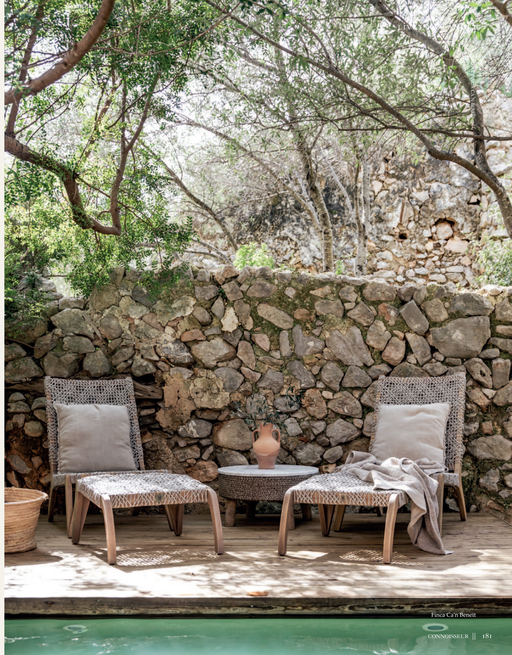
Finca Ca'n Beneit