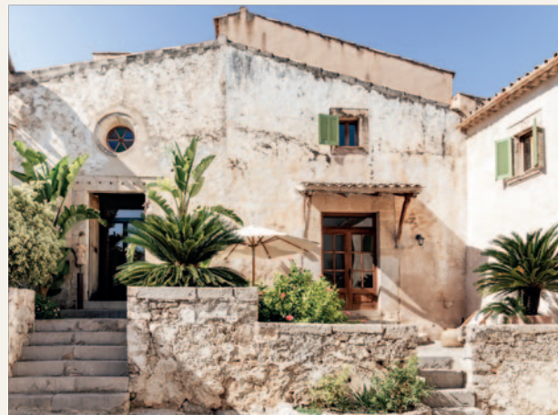
Finca Ca'n Beneit

www.virginlimitededition.com/son-bunyola