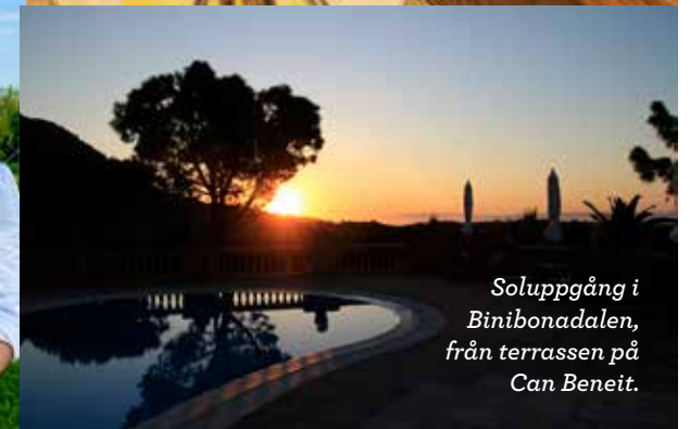
Soluppgång i Binibonadalen, från terrassen på Can Beneit.