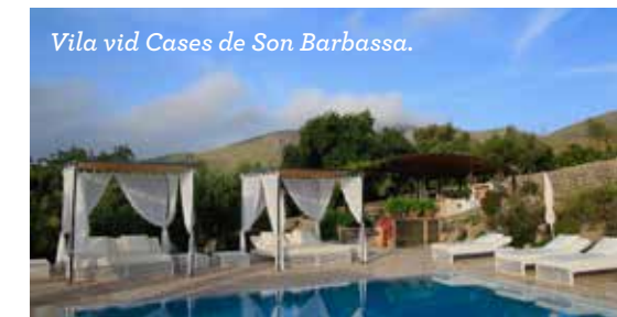
Vila vid Cases de Son Barbassa.