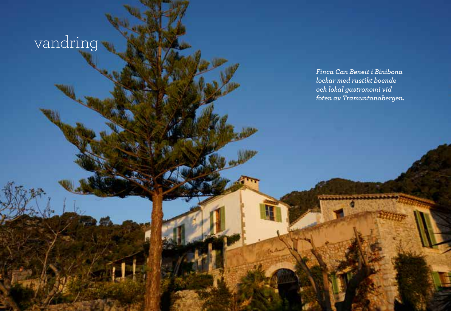
Finca Can Beneit i Binibona lockar med rustikt boende och lokal gastronomi vid foten av Tramuntanabergen.

DE VINDLANDE GRÄNDERNA bjuder dessutom på en mängd hantverksbutiker, kaféer, tapasbarer och restauranger, där La Fonda de L'Aigua är ett säkert tips. Den klart mest prisvärda om man gillar rustik lantmat med finesse.